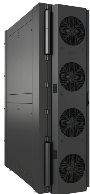
Vertiv™ Liebert® DCD con módulo activo