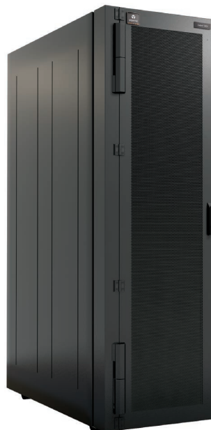
Vertiv™ Liebert® DCD pasivo

A medida que su negocio se expande y las demandas de refrigeración aumentan, es posible añadir el Liebert DCD a cada rack, lo que ofrece una escalabilidad simple y efectiva para responder a todas sus necesidades. Cuando las cargas de calor varían a lo largo del día, puede resultar difícil proporcionar una refrigeración adecuada y eficiente para satisfacer la demanda. Gracias al amplio rango de modulación del Liebert DCD, su centro puede adaptarse con rapidez a dichas condiciones cambiantes, sin importar con qué frecuencia varían durante el día, ofreciendo tranquilidad total al usuario final.