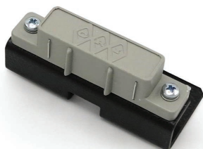
Detector de fugas