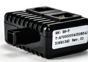
Sensor de temperatura SN-T