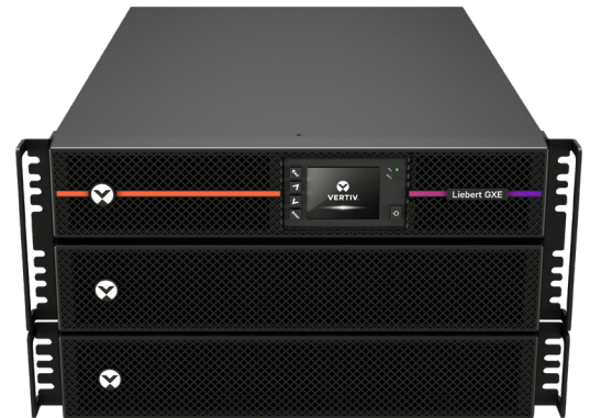
Vertiv™ Liebert® GXE da 6 kVA con armadio batterie esterno 2U opzionale