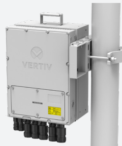
Montaje en poste, posición bandera