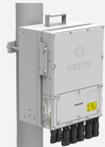
Montaje en poste, posición plana