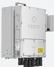
Montaje en pared, posición bandera