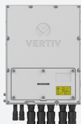
Montaje en pared, posición plana