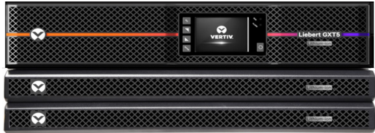
Onduleur Vertiv Liebert® GXT5LI 1-3 kVA et (2) EBC pour une durée d'autonomie prolongée

La technologie lithium-ion offre une durée de vie utile deux à trois fois supérieure à celle des batteries plomb étanche (VRLA), avec un coût total de possession réduit, rendant l'onduleur on line Liebert® GXT5 Lithium-Ion particulièrement adapté aux salles réseau et serveur, ainsi qu'aux autres applications edge critiques.