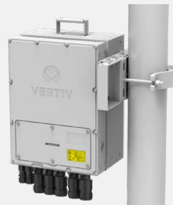
Montage sur poteau, position drapeau