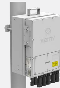
Montage sur poteau, position à plat