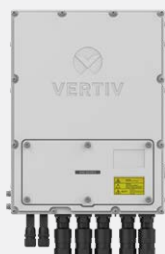
Montage mural, position à plat