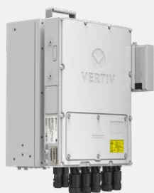
Montage mural, position drapeau