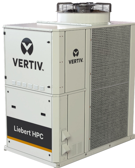
Vertiv™ Liebert® HPC-S avec réfrigérant à faible PRG

Le Liebert HPC-S à faible PRG est une solution clé en main entièrement équipée, où les principaux composants du système s'intègrent facilement permettant ainsi des économies de temps et de coûts d'installation.