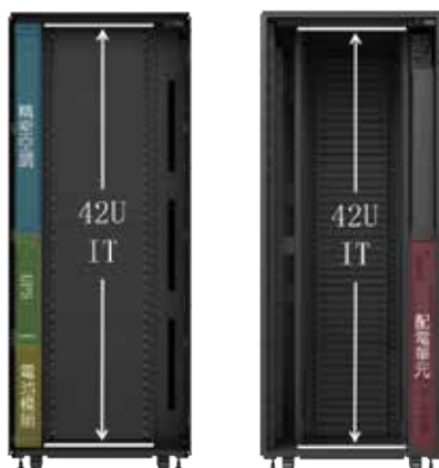
櫃內佈局 (前) 櫃內佈局 (後)